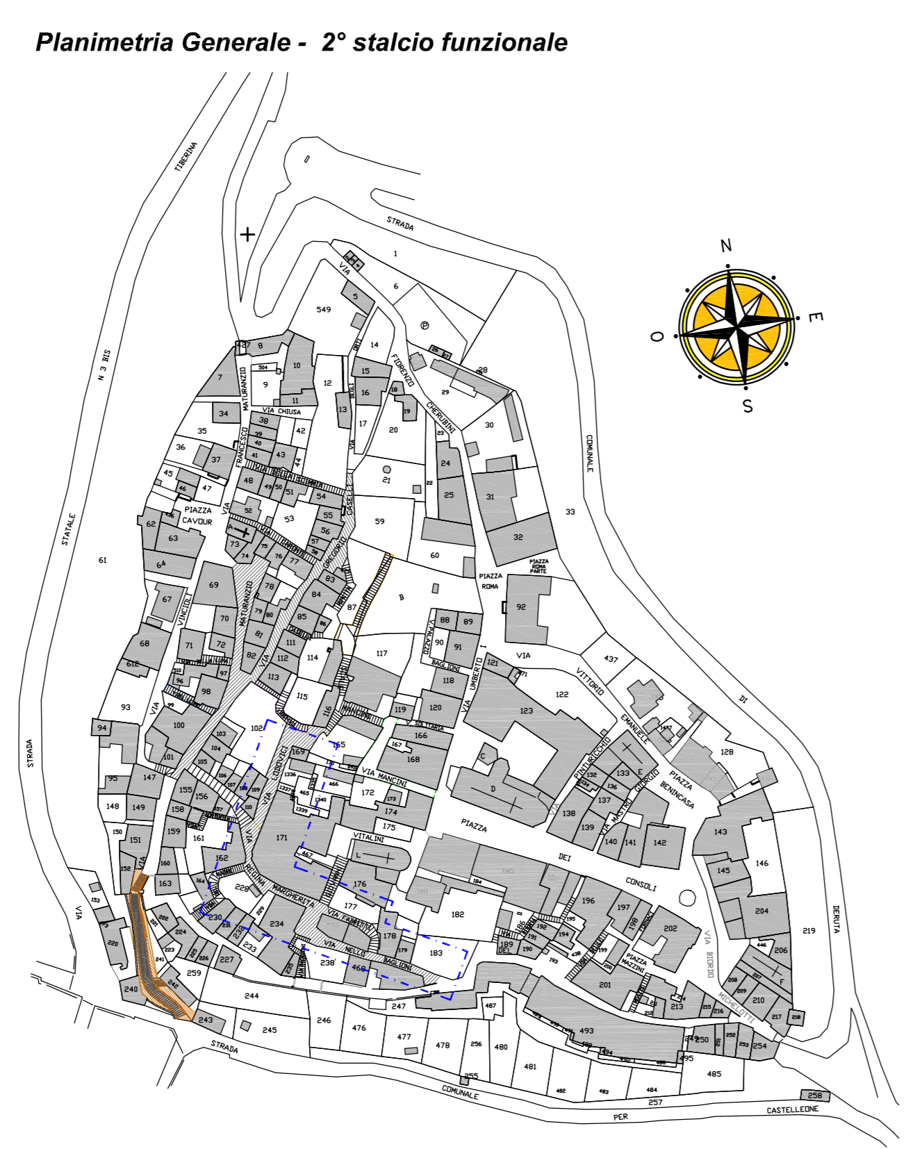
Via Lodovico - Via Fabretti - Via Nello Baglioni - SCALA 1: 200